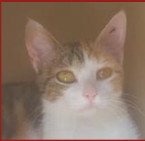
BOLI & EMY

Ces 5 juniors faisaient partie d'une colonie de chats errants, ils vivaient à l'intérieur de la cour d'une entreprise. Ils ont été trappés afin de leur éviter une vie de blessures, maladies et portées successives pour les femelles. Pour les 8 adultes, nous projetons de faire une campagne de stérilisation. Ces 5 boules de poils, qui n'ont jamais connu la main de l'homme, vont avoir besoin de temps pour s'habituer à un foyer car ils sont apeurés au moindre mouvement. Mais même pas peur ! Nous relèverons aussi ce défi ! Eux aussi méritent d'être heureux.