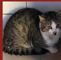
ARROW & GALLY

Les adultes restés sur place seront stérilisés bientôt.